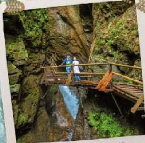
Tiefe, geheimnisvolle Schluchten