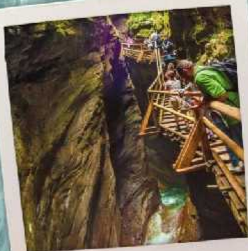
Ein unvergessliches Familienerlebnis